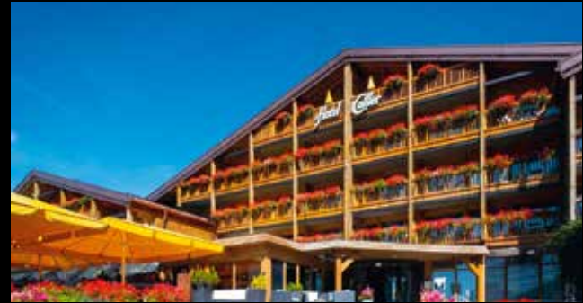
Séminaire d'automne Charmey : 1 – 2 octobre 2023