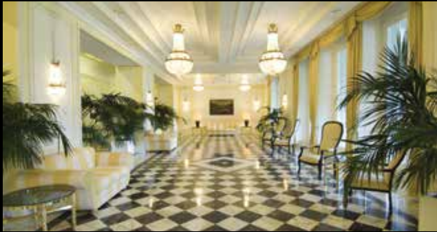
Herbstseminar Interlaken: 26. – 27. November 2023